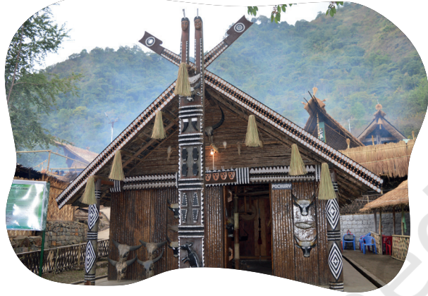
चित्रम् ५.३: किसामा धरोहरग्रामे मुक्तवायुसङ्ग्रहालयः यत्र नागालैण्डदेशस्य विभिन्नजनजातीनां गृहाणि सन्ति, प्रत्येकं विशिष्टविन्यासः अस्ति । एते च भवतः संग्रहालयस्य भागः भवितुम् अर्हन्ति ।