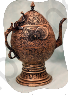
चित्रम् ५.१४ : पीतलम् काश्मीरतः चाय (समोवर) निर्माणार्थं घटः