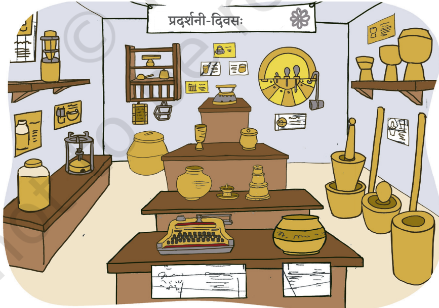
चित्रम् ५.१७ : संगृहीतकलाकृतीनां प्रदर्शनम्