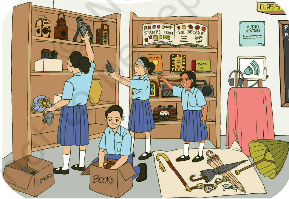
चित्रम् ५.१: विद्यालयसङ्ग्रहालयस्य स्थापना