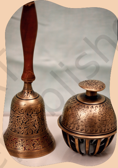
चित्रम् ५.६ : प्राचीनाः पीतलघण्टाः

संग्रहालये प्रदर्शनार्थं चिताषु कलाकृतीषु एकं चिनुत । तस्य इतिहासं विकासं च दर्शयन् समयरेखां रचयन्तु, यत्र सामान्यतया कदा तस्य उपयोगः अभवत्, यदि अद्यापि प्रयुक्तः अस्ति तर्हि तस्य उपयोगः कथं भवति । भवन्तः तत्सम्बद्धाः महत्त्वपूर्णघटनाः अपि अभिलेखयितुं शक्नुवन्ति, यथा, कश्चन बन्धुजनः भवतः पितामहस्य विवाहस्य अवसरे उपहाररूपेण आनयत्, ग्रामे च एतत् प्रथमम् आसीत् (उदाहरणार्थं पुरातनं रेडियो वा कॅमेरा वा) ।