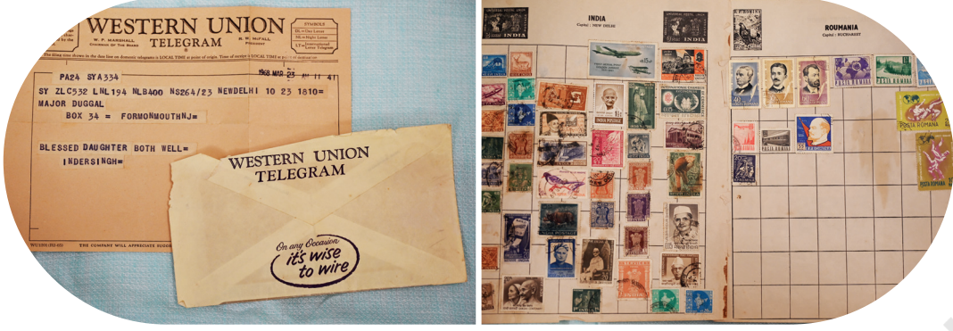
चित्रम् ५.१३ : १९६० तमे दशके तारपत्राणि मुद्रापत्राणि च

यथा - पीतलपदार्थं प्रक्षाल्य पालिश इति कर्तव्यं, काष्ठवस्तुं मृदुकूर्चेण धूलिपातं कर्तव्यं, वस्त्राणि च सावधानीपूर्वकं लम्बनीयानि, नखैः तीक्ष्णधारैः वा दूरं छायाचितं सावधानीपूर्वकं लिफाफामध्ये स्थापयितव्यं, येन ते न नमन्ति, आकारात् बहिः वा न भवन्ति इति सुनिश्चितं भवति ।