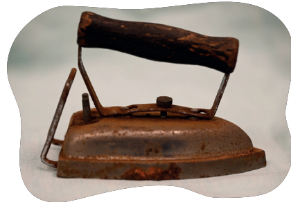
चित्रम् ५.७ : १९५० तमे दशके पुरातनं याला-लोहं यत् विद्युत्-कार्यं करोति स्म

समूहस्य अन्तः पञ्च कलाकृतयः चिनुत ये संग्रहालये प्रदर्शनस्य भागः भवेयुः इति भवन्तः मन्यन्ते । भवद्भिः सर्वैः सहपाठीभिः सह प्रदर्शनीनां अन्तिमसमूहस्य निर्णयः करणीयः भविष्यति । स्मर्यतां यत् भवता सम्यक् चयनं करणीयम्, अपि च भवता एतानि कलाकृतयः किमर्थं चिनोति न तु अन्ये इति अपि व्याख्यातव्यम् ।