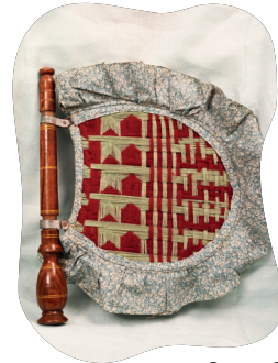
चित्रम् ५.१५ : पुनः प्रयुक्तेन ऊर्णेन वस्त्रेण च निर्मितं पुरातनं हस्तनिर्मितं व्यजनं (पंखा) यत् विद्युतः आगमनात् पूर्वं सर्वेषु गृहेषु पूर्वं प्रयुज्यते स्म