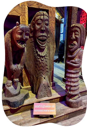
चित्रम् ५.२ : भोपालनगरस्य मध्यप्रदेशस्य जनजातीयसङ्ग्रहालये विभिन्नजनजातीनां पारम्परिककला, शिल्प, संस्कृतिः च प्रदर्शिताः सन्ति