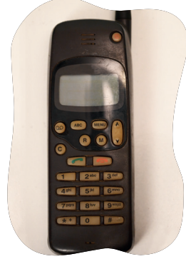
चित्रम् ५.९ : १९९८ तमस्य वर्षस्य मोबाईल-फोनः

सर्वाः कलाकृतयः महत्त्वपूर्णाः सन्ति, अन्तिमप्रदर्शने भवतः कलाकृती न समाविष्टा तथा च भवता स्थानीय-इतिहासस्य संस्कृतेः च विषये किञ्चित् बहुमूल्यं ज्ञातम् ।