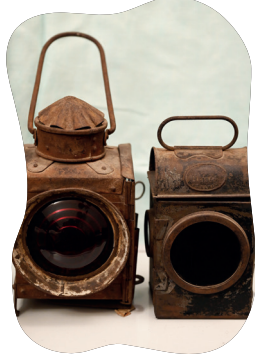
चित्रम् ५.८ : पुरातनरेलवेदीपाः