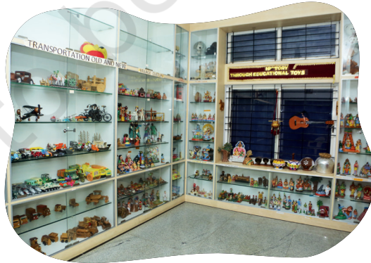
चित्रम् ५.१६: शैक्षिकक्रीडासामग्रीणाम् इतिहासं दर्शयति विद्यालये संग्रहालयस्य प्रदर्शनम्

आगन्तुकानां कृते प्रदर्शयितुं पूर्वं स्वसमूहे विद्यमानस्य कलाकृतेः मौखिकं वर्णनं दातुम् अभ्यासं कुर्वन्तु ।