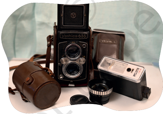
चित्रम् ५.१० : १९६० तमे दशके आरम्भस्य कॅमेरा, फ्लैश, लेन्स च