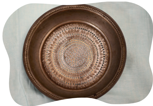
चित्रम् ५.११ : १९४० तमे दशके पीतलचालनी