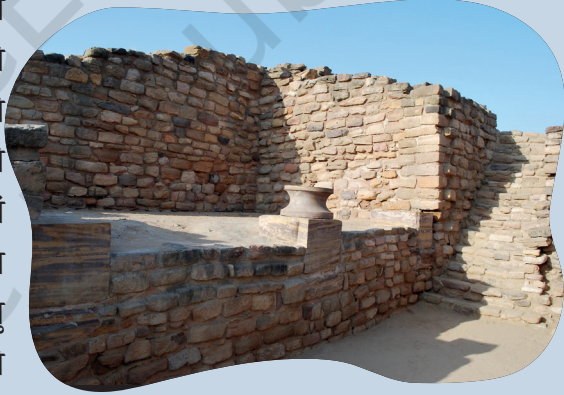
चित्रम् ५.४ : दुर्गस्य पूर्वद्वारे धोलावीरायां प्रहरणकक्षम्

पुरातत्त्वस्थलानि तानि स्थानानि सन्ति यत्र प्राचीनमानवसमाजानाम् प्रमाणानि सुरक्षितानि सन्ति । एतानि स्थलानि पुरातत्त्वविदैः उत्खनितानि सन्ति । ते एतानि स्थलानि सावधानीपूर्वकं खनन्ति, अनावृतानां कलाकृतीनां अन्यावशेषाणां च विश्लेषणं कुर्वन्ति । एताः कलाकृतयः अस्मान् एतेषु स्थलेषु बहुवर्षपूर्वं ये समाजाः आसन् इति अवगन्तुं साहाय्यं कुर्वन्ति । उत्खननकाले आविष्कृतानि वस्तूनि स्थलस्य समीपे स्थिते संग्रहालये स्थापितानि सन्ति ।