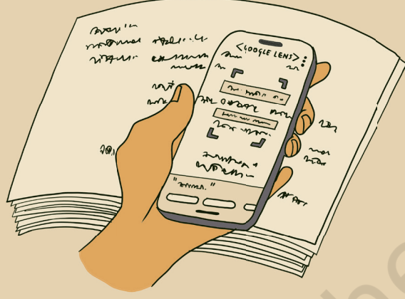
चित्रम् ५.१२: अनुवादार्थं एआइ-उपकरणानाम् उपयोगः

गूगल लेन्स, माइक्रोसॉफ्ट आफिस लेन्स, एडोब स्कैन, टेक्स्ट फेयरी इत्यादीनां एआइ-उपकरणानाम् उपयोगेन ऑप्टिकल कैरेक्टर रिकॉग्निशन् (ओ.सी.आर्.) इत्यस्य उपयोगेन चित्रेभ्यः पाठः पठितुं शक्यते । भवन्तः तान् पुरातनप्रारूपं पठितुं दुष्पठनार्थं प्रारूपम् अनुवादयितुं वा शक्नुवन्ति यत् भवन्तः अवगच्छन्ति ।