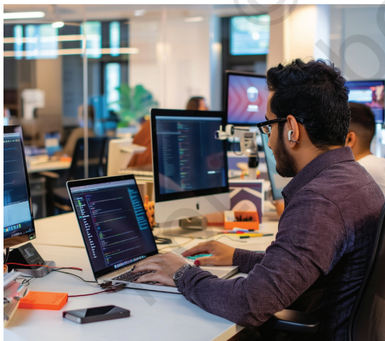
സോഫ്റ്റ് വെയർ വികസനം

വെയർഹൗസുകൾ: ഉൽപ്പന്നങ്ങൾ വിൽക്കുകയോ ഉപയോഗിക്കുകയോ കടകൾക്ക് വാടകയ്ക്ക് നൽകുകയോ ചെയ്യുന്നതിന് മുമ്പ് അവ സംഭരിക്കാൻ ഉപയോഗിക്കുന്ന വലിയ കെട്ടിടങ്ങൾ.