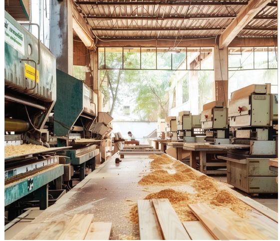
ഫർണിച്ചർ നിർമ്മാണ യൂണിറ്റ്