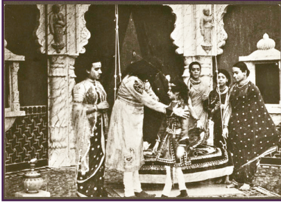
पारशी नाटक मंडळ

भारतांत वेगवेगळ्या वाठारांनी भोंवपी पयलें कंपनी नाट्य पंगड म्हळ्यार 1850 ते 1930 ह्या काळांत पुराय भारतांत नाटकां सादर करपी मुंबय, महाराष्ट्रांतल्यो 'पारशी नाट्य कंपन्यो'.