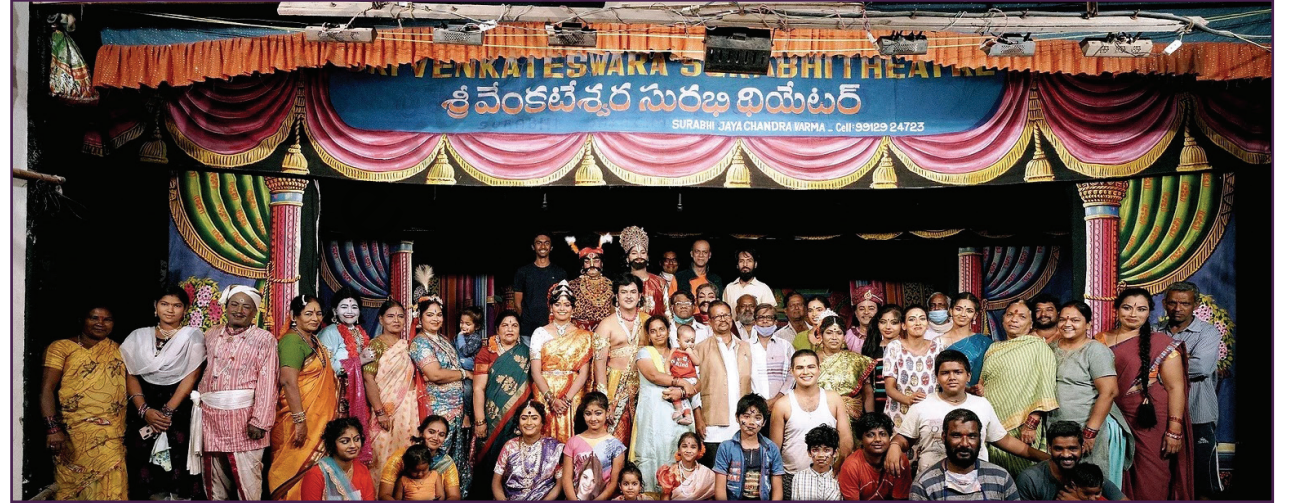
एका कार्यावळी उपरांत कंपनी थिएटर पंगड