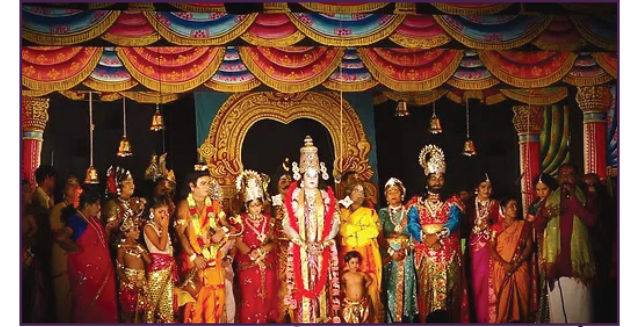
सुरभी नाट्य नाटकां जादू, जिवंत व्ही. एफ. एक्स. आनी तर्क वापरून माचयेर कारस्थानां आडावपा खातीर वळखतात.

आंध्र प्रदेशांत 1885 वर्सा सुरभी रंगभूमी वा श्री वेंकटेश्वर नाट्य मंडळी स्थापन जाली. ताचें पयलें नाटक