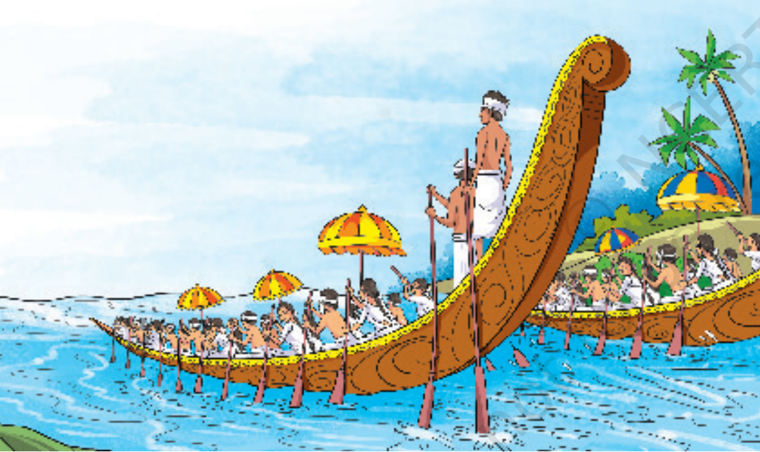
কেৰালাৰ সৰ্প নৌকা প্ৰতিযোগিতা

এটি ৰক্ষিপাট্টু শিকা। ৰক্ষিপাট্টু হৈছে এবিধ পৰম্পৰাগত নৌকা খেল, ই বিশেষকৈ কেৰালাৰ বৃহত্ হৃদ আদিত অনুষ্ঠিত হোৱা বিখ্যাত সৰ্প নৌকা খেল। এই নৌকা প্ৰতিযোগিতা ৰাজ্যখনৰ সাংস্কৃতিক উৎসৱৰ এক অবিচ্ছেদ্য অংশ। এই প্ৰতিযোগিতাত জীৱন্ত আৰু ছন্দময় নৌকা গীতও যুক্ত।